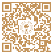
南方科技大学公众号