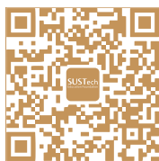
教育基金会公众号