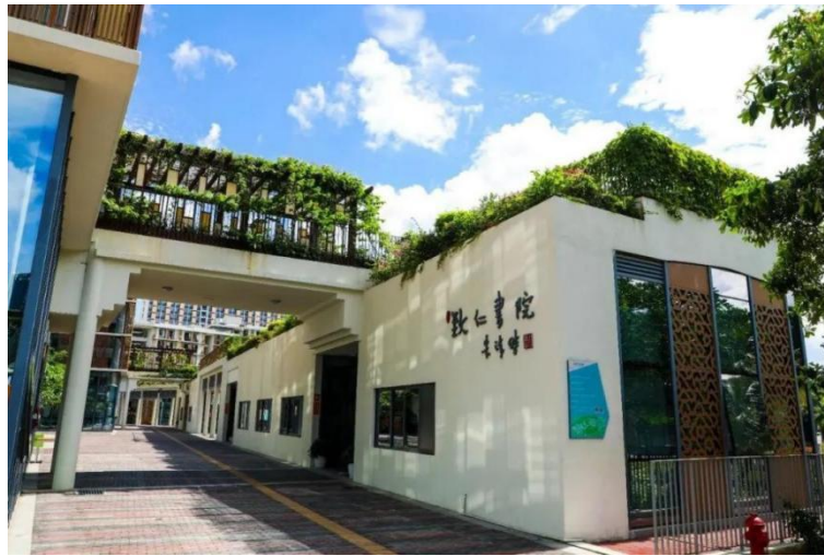
图 2 致仁书院

献”的“若水”精神，鼓励那些在求学乃至人生道路上不为人知的“挣扎”和努力，肯定那些全力以赴的热爱和奉献。